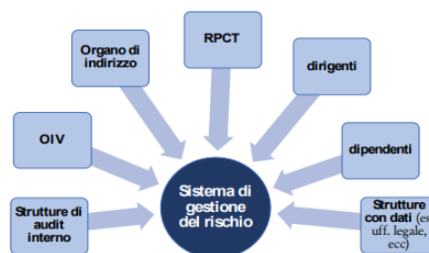
Figura 2 - Gli attori coinvolti nel sistema di gestione del rischio

Inoltre, al fine di realizzare la prevenzione, l'attività del Responsabile deve essere strettamente collegata e coordinata con quella di tutti i soggetti presenti nell'organizzazione.